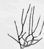
DEMI-TIGE / Tronc de 1m50 tous les fruitiers

Les arbres en tige (tronc de 1m80/2 m) et en demi-tige (tronc de 1m20/1m50) sont traditionnellement greffés, en pépinière, sur le même porte-greffe vigoureux. L'arbre aura donc la même taille à âge adulte. Il est souvent préférable de choisir une haute-tige qui vous permet d'implanter des strates inférieures ou de profiter de la place au sol en pouvant circuler librement sous son arbre.