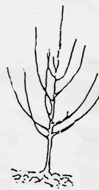
QUENOUILLE ou BASSE-TIGE tous les fruitiers

Comme les porte-greffes nanifiants ont une masse racinaire restreinte, un bon paillage voire un arrosage ponctuel leur est profitable pendant les périodes de sécheresse et dans les sols se ressuyant rapidement. Le tuteurage aussi est bénéfique aux porte-greffes nanifiants, et ce, durant toute la vie du verger.