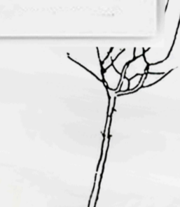
TIGE ou HAUTE-TIGE / Tronc de 2m tous les fruitiers